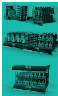
projeto para organização de gôndola para linha miudezas - Niely.